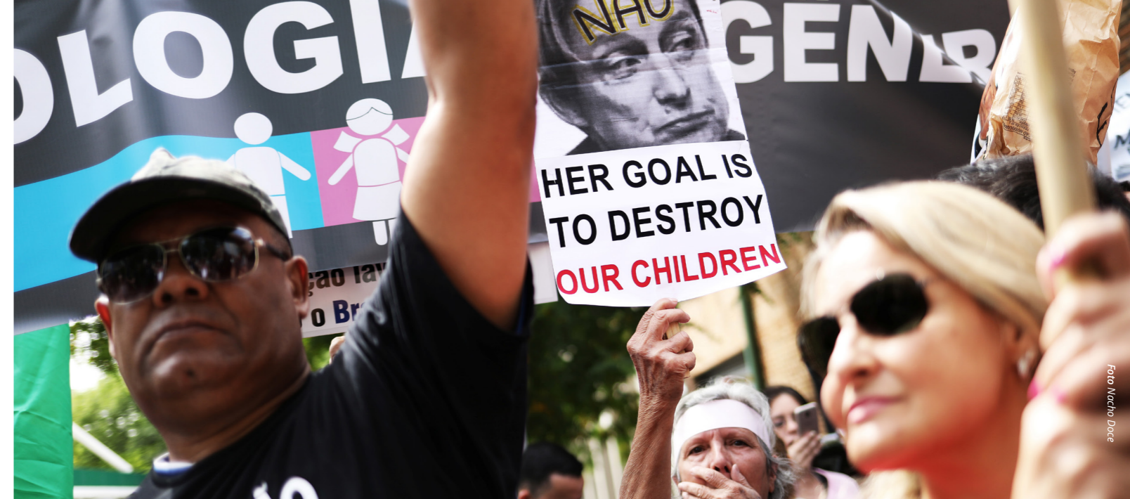
Protester mot den nordamerikanska filosofen och genusteoretikern Judith Butler under hennes tal på ett brasiliansk universitet i november 2017.