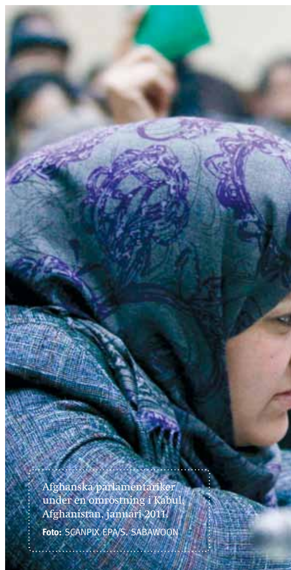
Afhanska parlamentariker under en omröstning i Kabul, Afghanistan, januari 2011.

inget. Förändringsprocesser kräver förhandling och diskussion. Men förändringsprocesser är svåra. Därför blir det business as usual. Det är påfallande. Vi gör som vi alltid gör. Och då blir det som