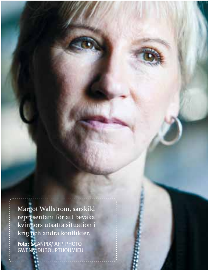
Margot Wallström, särskild representant för att bevaka kvinnors utsatta situation i krig och andra konflikter.