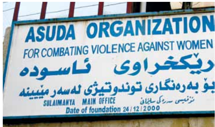
Asuda är Kvinna till Kvinna:s samarbetsorganisation i Kurdistan, Irak. De erbjuder jourtelefon och skyddat boende för kvinnor samt juridisk och psykologiskt stöd till kvinnor som utsatts för våld.

Talande för den bristande jämställdheten är överrepresentationen av män i världens parlament. Endast 25 av världens 186 länder har 30 procent kvinnor i sina parlament eller mer. Nio länder har noll procent och 42 länder har mellan en och tio procent kvinnor i sina parlament. 65 Högst kvinnorepresentation i världen har Rwanda där ett kvoterings-