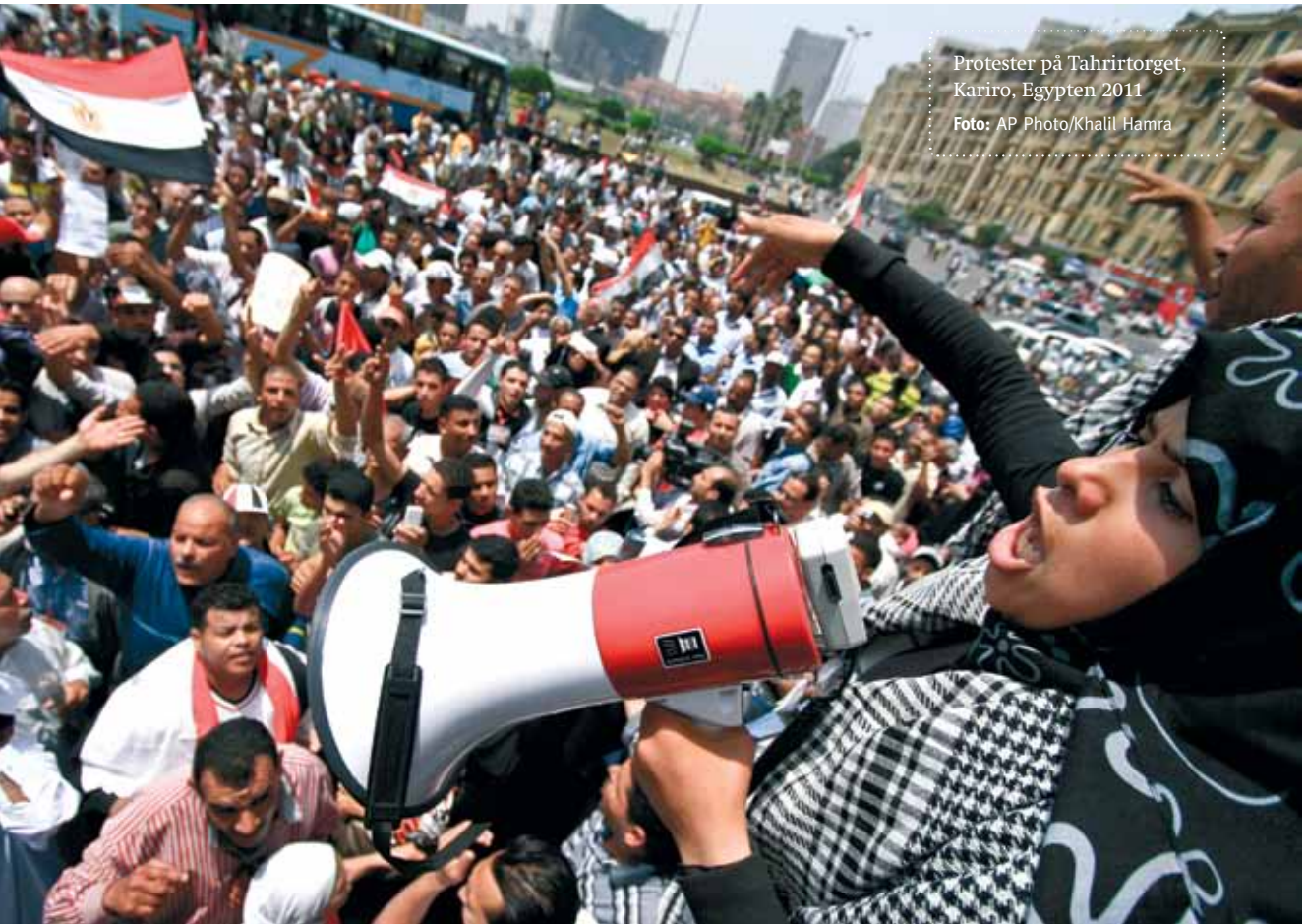
Protester på Tahrirorget, Kairo, Egypten 2011

Det har varit manliga experter från västvärlden som har angett att kvinnor inte kan sitta ner vid förhandlingsbord