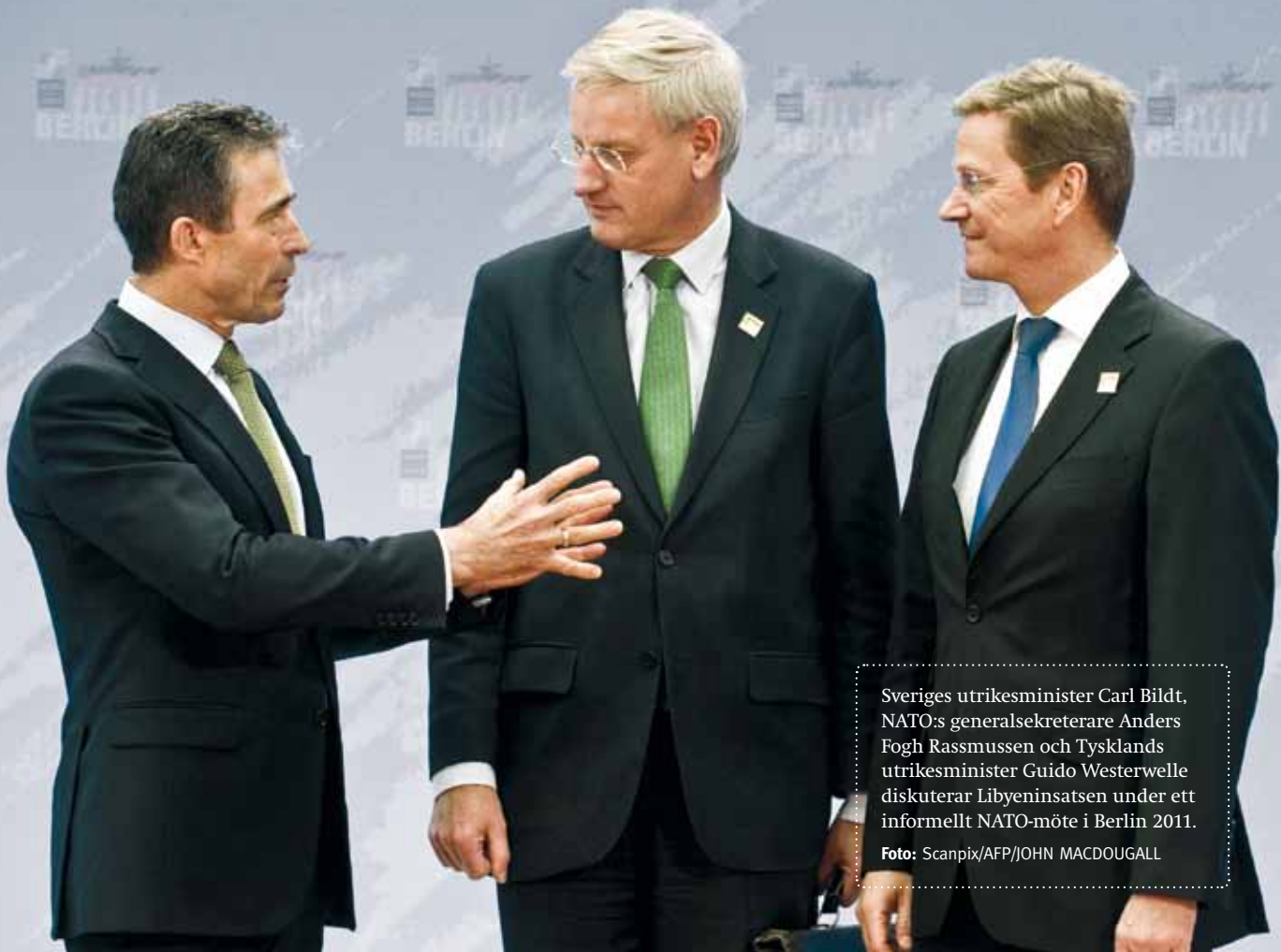
Sveriges utrikesminister Carl Bildt, NATO:s generalsekreterare Anders Fogh Rasmussen och Tysklands utrikesminister Guido Westerwelle diskuterar Libyens insats under ett informellt NATO-möte i Berlin 2011.