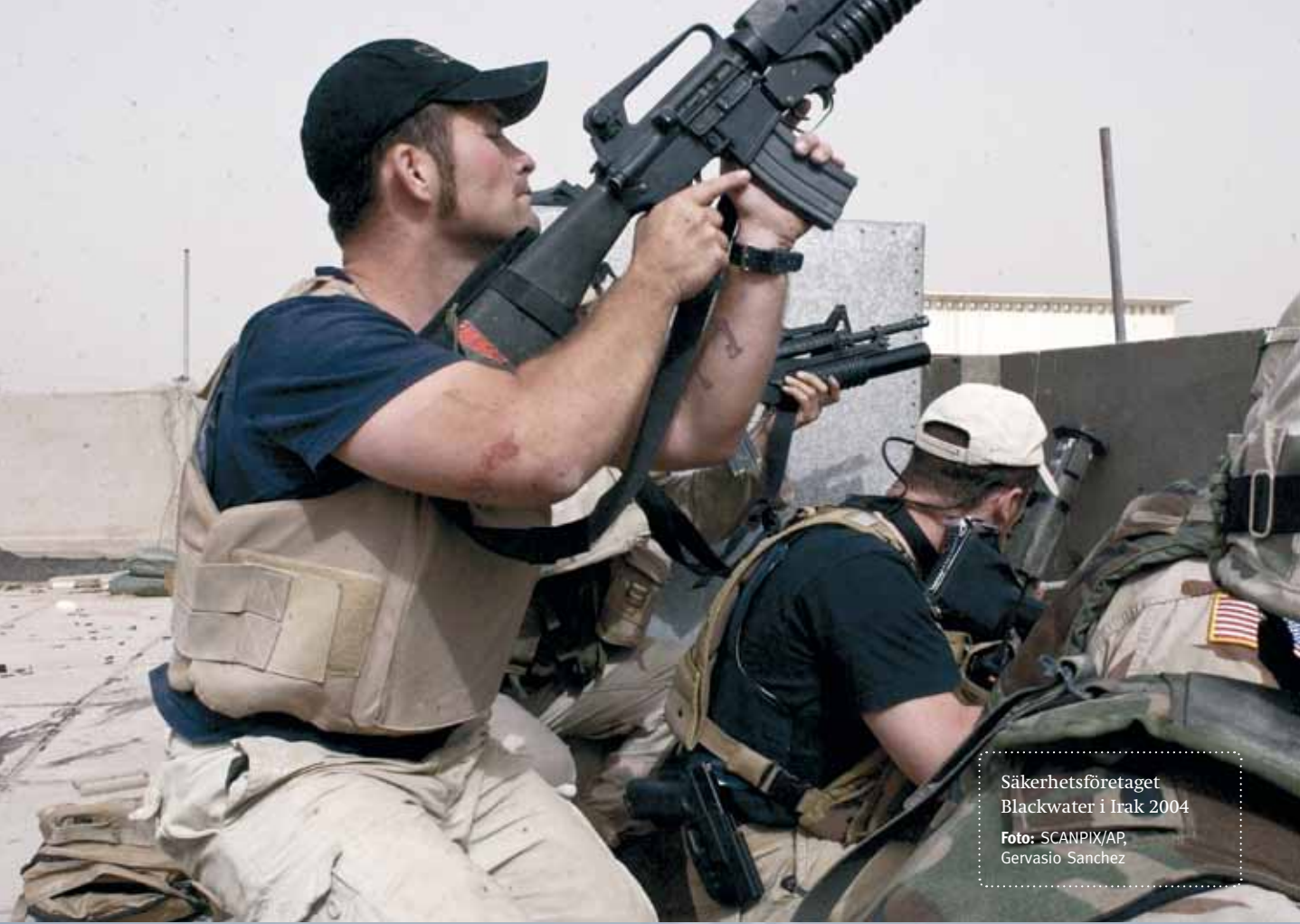
Säkerhetsföretaget Blackwater i Irak 2004