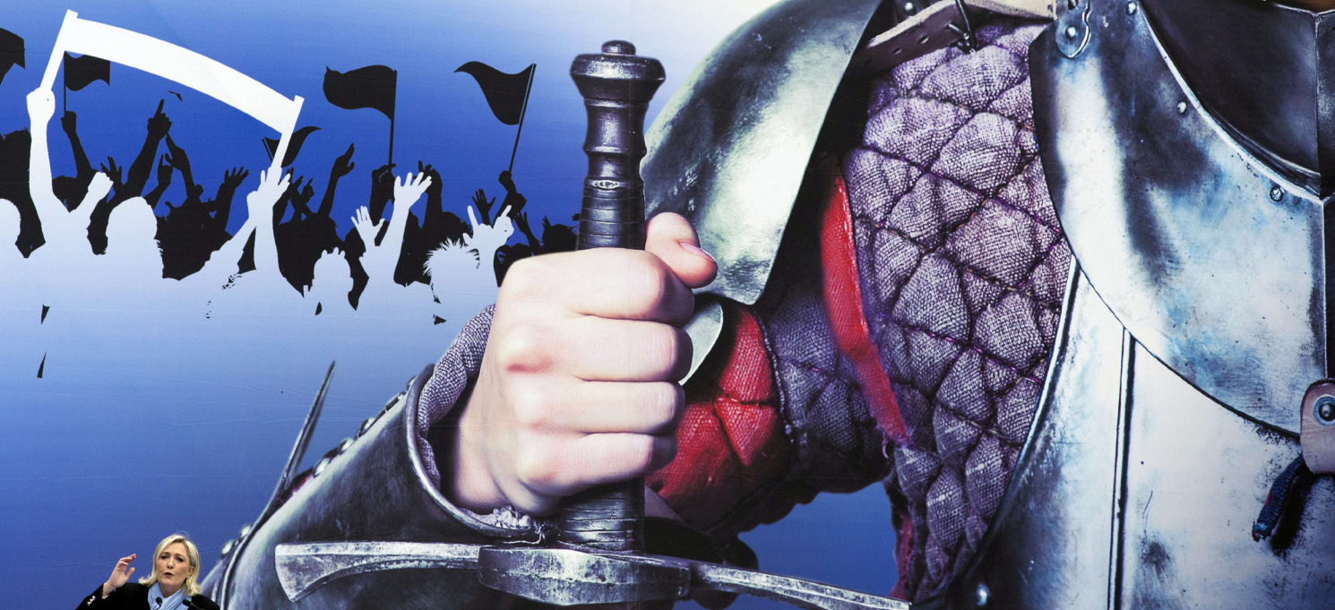
Nationella frontens ledare Marine Le Pen jämför sig gärna med Frankrikes nationalhelgon Jeanne d'Arc.