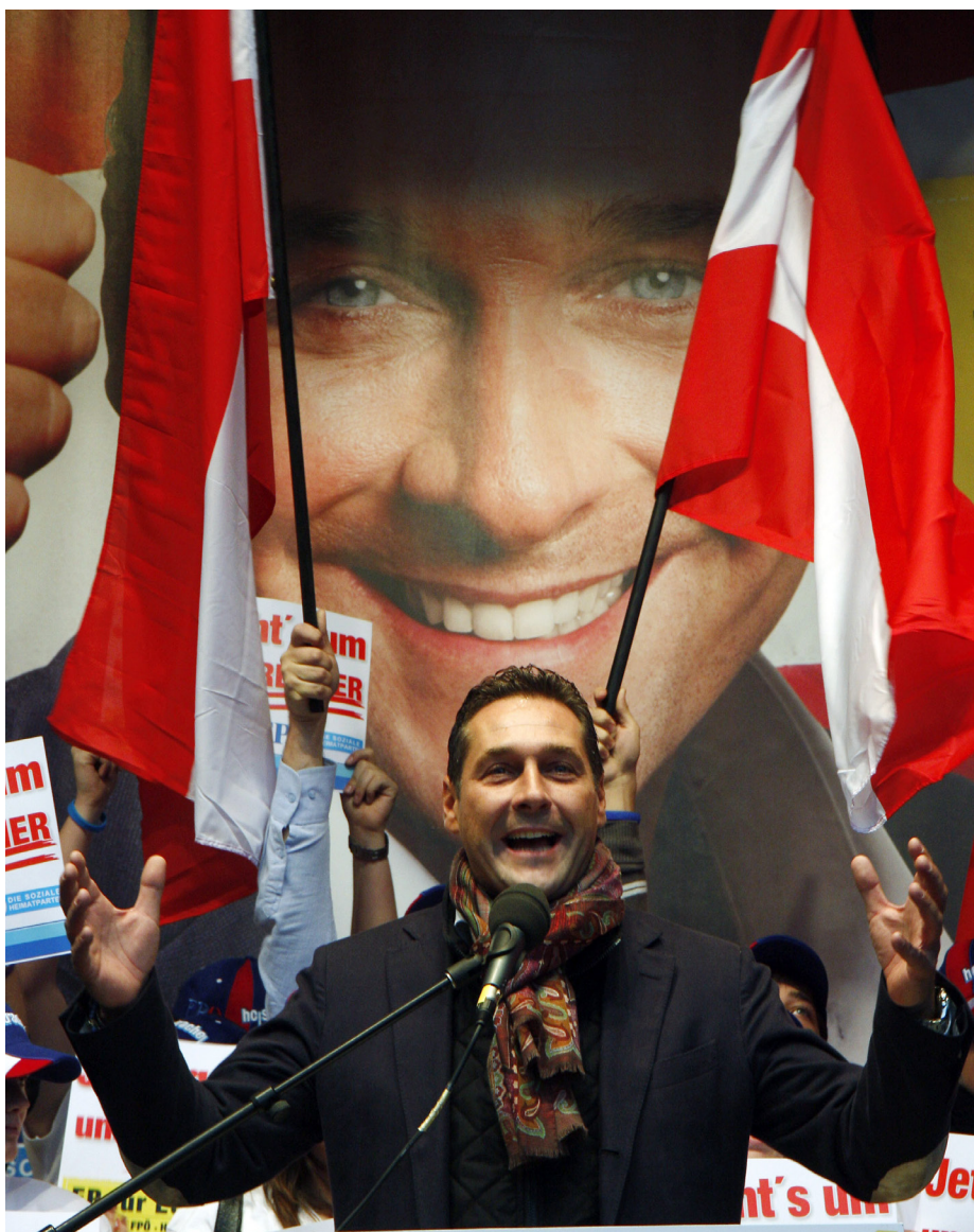
HC Strache leder österrikiska FPÖ.