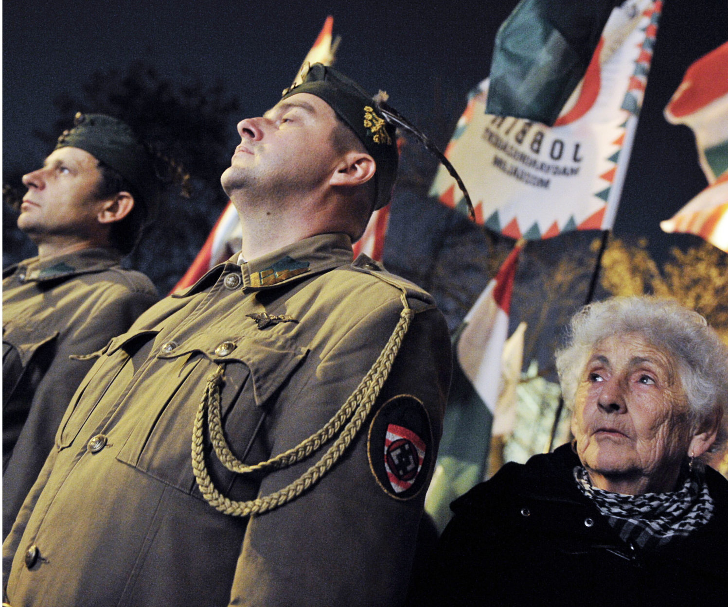
Det ungerska antisemitiska partiet Jobbik säger sig vilja försvara ungerska värden.