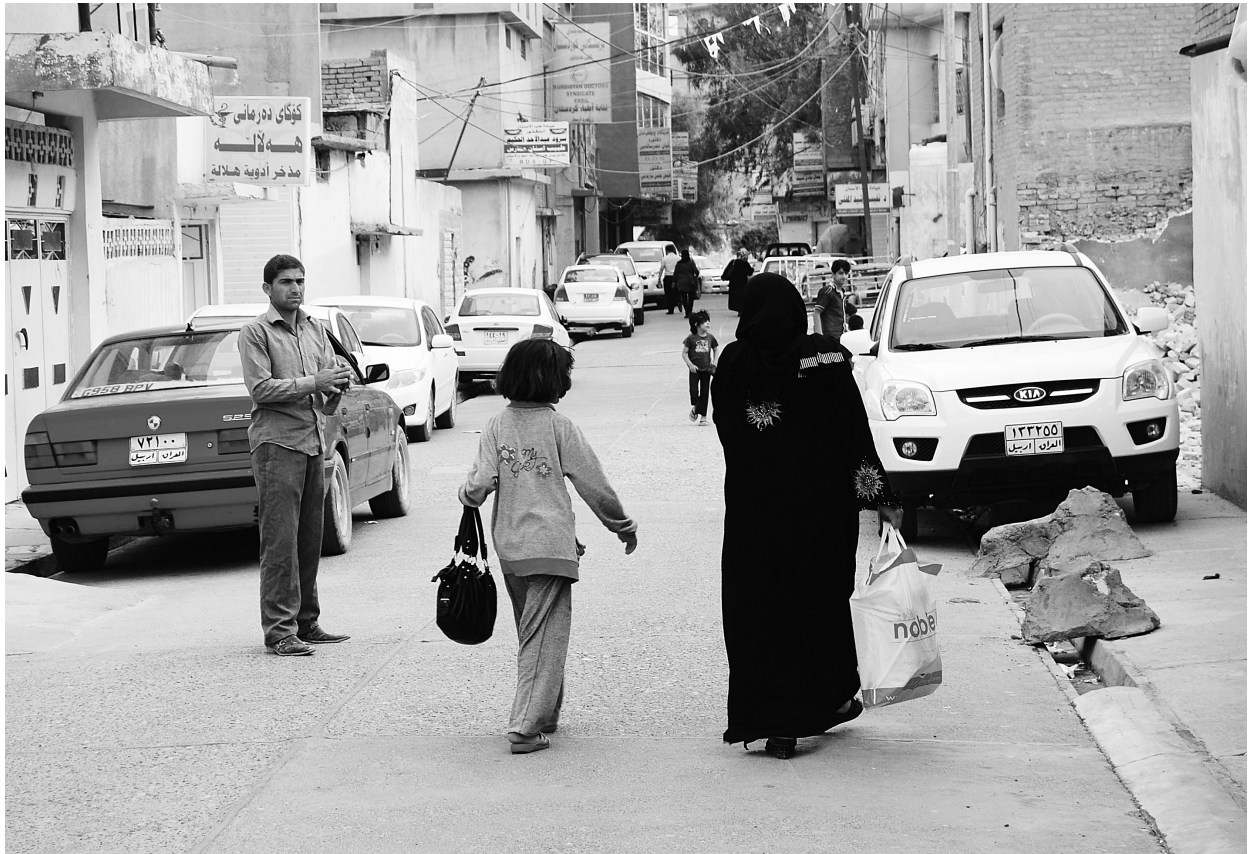
Preko polovine svih priča o miru i ratu učvršćuje rodne stereotipe, prema izvještaju Globalnog projekta medijskog monitoringa iz 2010. godine. Na slici je ulica u Iraku, zemlji u kojoj se žene rijetko čuju.