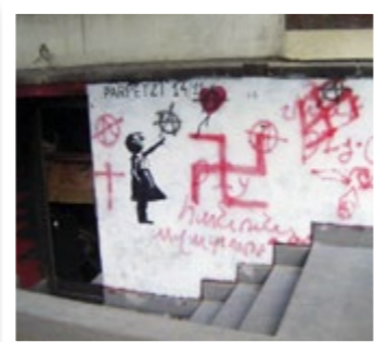
Hakkors klottrat utanför Tsomak Ogas klubb i Jerevan, som brändes ned av nazister.

Ser du en på gatan som inte ser ut som du utan som, ja du vet vilka vi menar, då löser vi det på vårt sätt.” Vilket betyder att misshandla och döda.