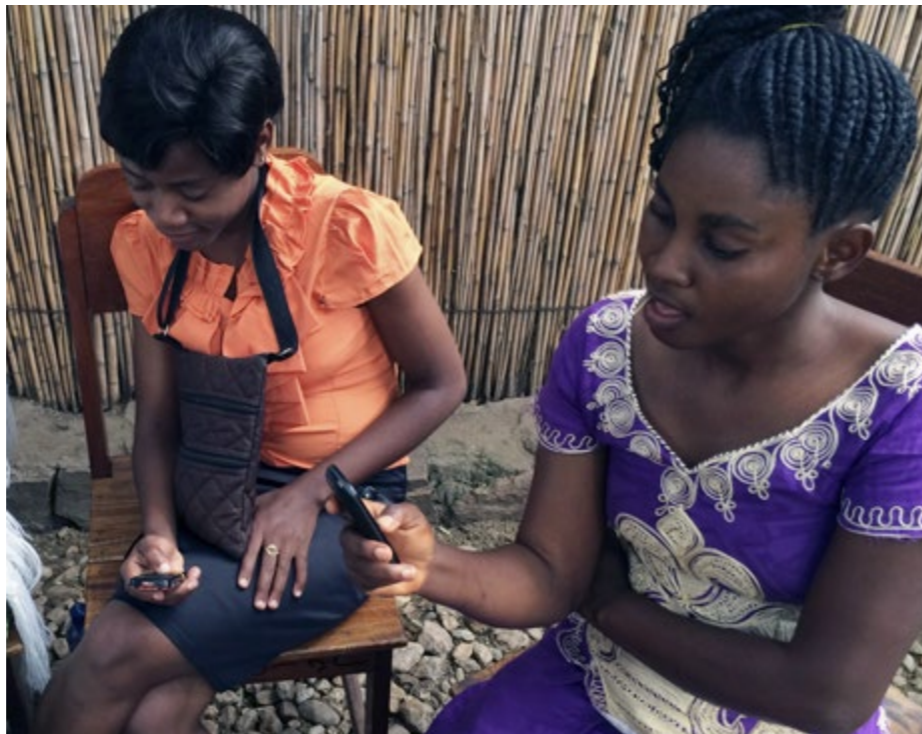
Uppkopplad – och utsatt. Hot tillhör vardagen för femdefenders i DR Kongo 2014.

Under 2014 hotades och attackerades organisationen Women in Black vid ett flertal tillfällen när de krävde ansvar för krigsbrott som begicks under 1990-talet. I juli misshandlades fyra aktivister i västra Serbien när organisationen höll en minnesceremoni för massakern i Srebrenica.